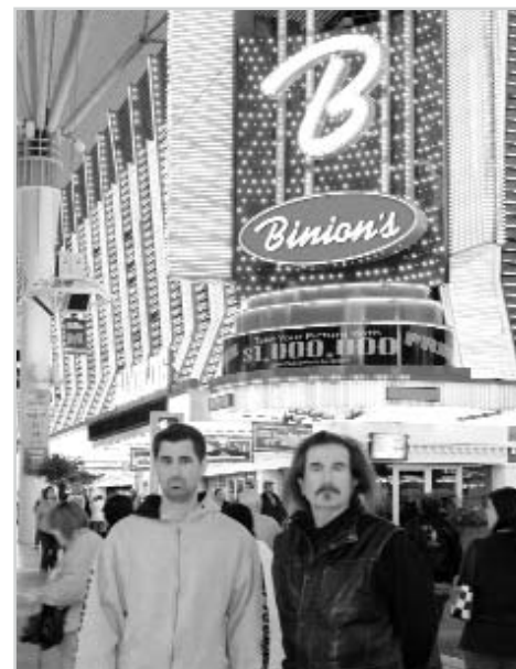
En la imagen de la izda, vista del Norte Strip. A la dcha, la parte antigua de Downtown

¿Cómo se toma la vida la gente de Las Vegas?